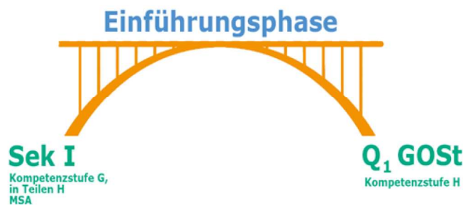
Abb. 1 Brückenfunktion der E-Phase

Für einen erfolgreichen Übergang in die Qualifikationsphase der gymnasialen Oberstufe werden in der Jahrgangsstufe 11 die Kompetenzen entsprechend dem Kompetenzstufenmodell der Sekundarstufe I (RLP 1 - 10 Berlin Brandenburg) weiterentwickelt.