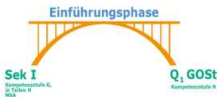
Abb. 1 Brückenfunktion der E-Phase

Für einen erfolgreichen Übergang in die Qualifikationsphase der gymnasialen Oberstufe werden in der Jahrgangsstufe 11 die Kompetenzen entsprechend dem Kompetenzstufenmodell der Sekundarstufe I (RLP 1 – 10 Berlin Brandenburg) weiterentwickelt.