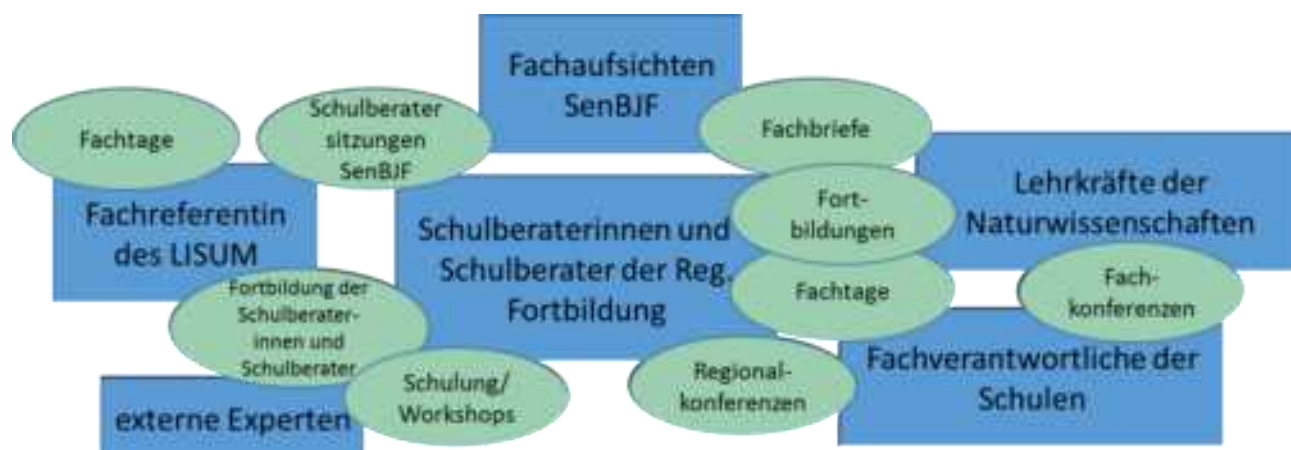
Abb. 6 Formate des Implementierungsprozesses